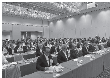
総会前の会場風景

5月30日(木)～5月31日(金)に箱根町で関東商工会議所連合会総会が、1都8県より159名の参加者(うち千葉県24名)のもと開催されました。