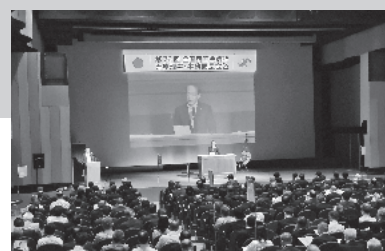
多くの参加者が集い、開催されました

5月23日(木)～5月24日(金)に長野市で全国商工会議所専務理事・事務局長会議が、429名のリアル参加者(うち千葉県17名)のもと開催されました。