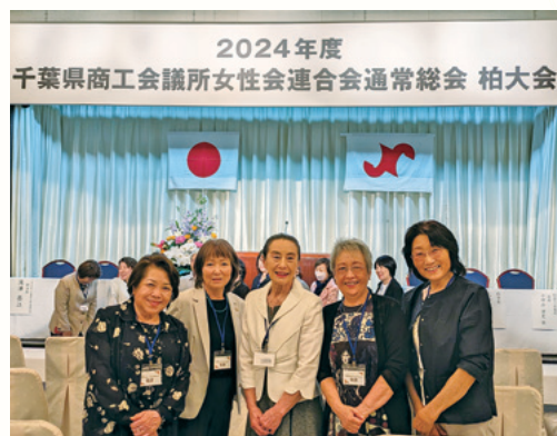
柏大会の会場において

今年度、総会を担当された柏女性会は とても元気で明るく「自信をもっておもてなしできる選択肢が食と音楽」ということで、とても素晴らしい総会・懇親会でした。当会が自信をもっておもてなしできる選択肢は何だろうと、参加者全員が思いを巡らした会でした。