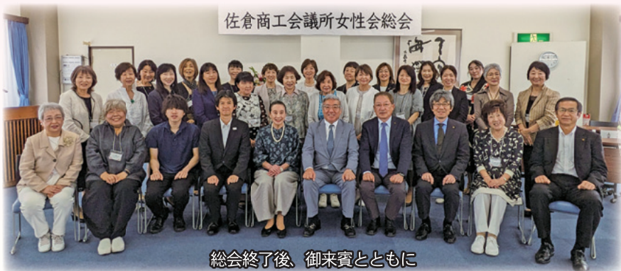
総会終了後、御来賓とともに