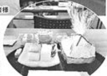
試食会で提供された商品